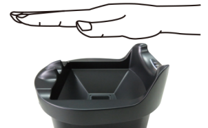
静脈認証タイムレコーダー

地場配送、複数配送、長距離運行、車両の乗り換え、同乗者など、様々なデジタルデータを自動判別し勤怠データを作成します。運輸業に特化した勤怠システムです。